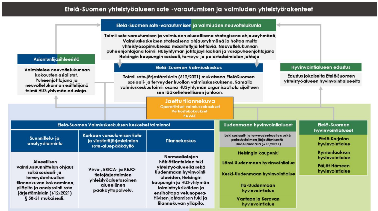
Kuva 2. Etelä-Suomen yhteistyöalueen sosiaali- ja terveydenhuollon varautumisen ja valmiuden yhteistyörakenteet

Valmiuslain kokonaisuudistuksen (OM015:00/2022) tai muiden keskeisten valmiutta ja varautumista ohjaavien lainsäädäntömuutosten jälkeen sopijapuolet selvittävät alueellisen valmiuden säätelyjärjestelmän sisältöä ja käyttöönoton mahdollisuutta.